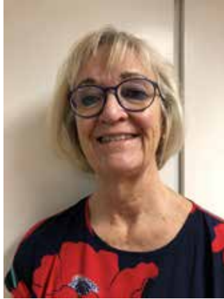
Ordförande har ordet