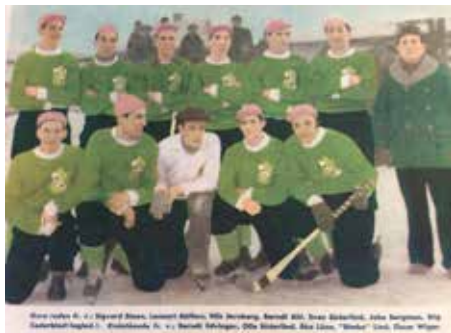
”Sundbybergs IK bandylag - dock från 1948”