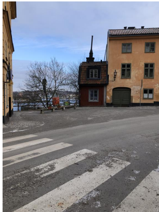
En bakgård på Glasbruksgatan och fram till Nytorgsgatan med sitt lilla röda hus.