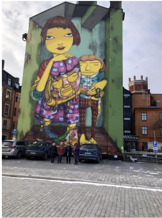
Vi fortsatte över Mosebacketerassen till Muralmålningen