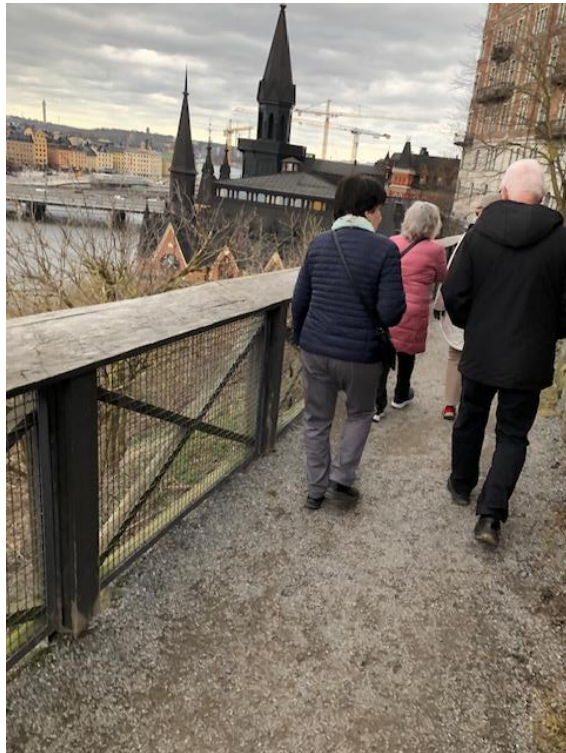
Vi beundrade Stadshuset innan vi gick vidare förbi Mariahissen