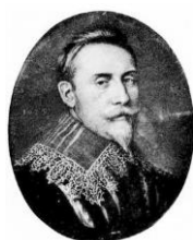
Gustav II Adolf 1594-1632