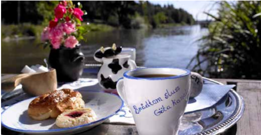
BRÅDTOM SLUSSCAFÉ, GÖTA KANAL VÄSTERBY, NORSHOLM.

Redaktör: Li Teske 013-10 63 75, info@ostergotland.se www.pro.se/ostergotland