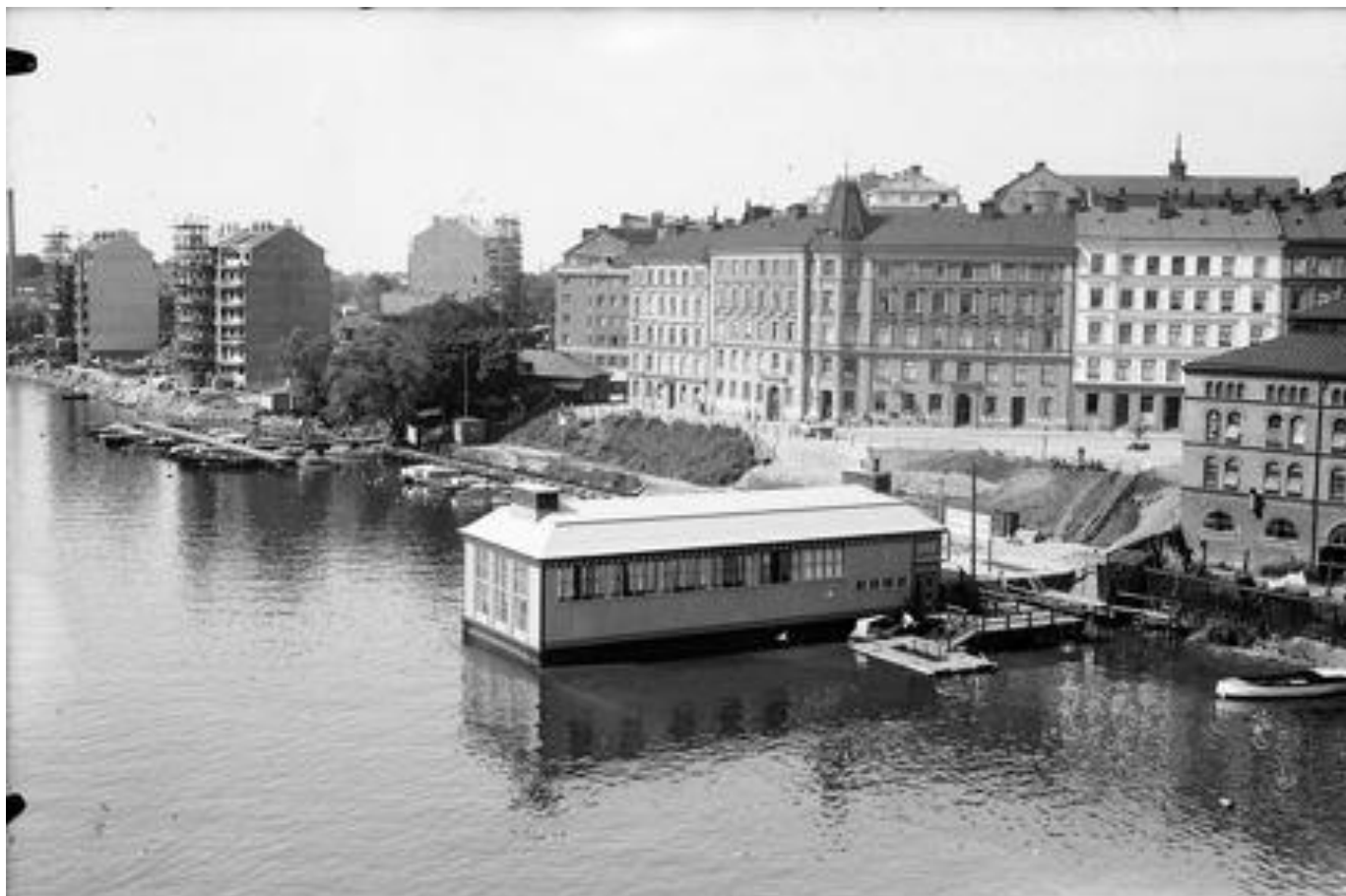
Liljeholmsbadet 1930.

Liljeholmsbadet invigdes 1930. Det byggdes på ett varv i Nyköping och fraktades via Södertälje kanal till sin plats vid Hornstull. En gång på 50-talet sjönk badet, men man bärgade och renoverade det. Nu är det sannolikt borta från sin ursprungliga plats för alltid.