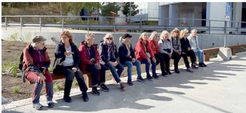
Trots motivet blev det ingen långbänk i Årsta i höstas.