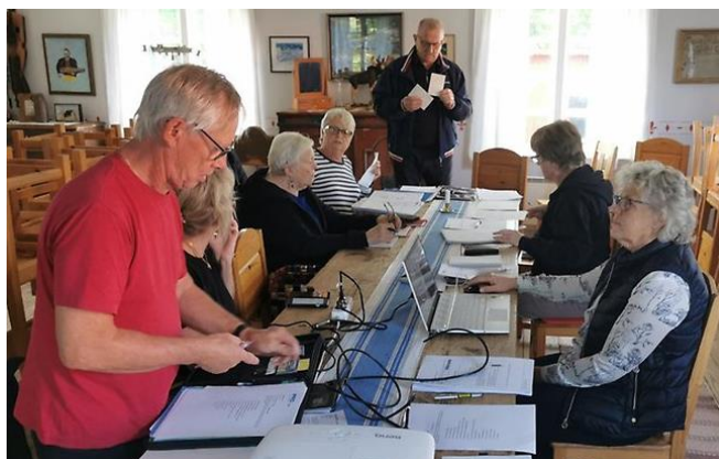
Styrelsemöte 24 september i Tegelsmora Hembygdsgård

Styrelsen har under året haft fem(5) protokollförda sammanträden varav ett sammanträde var ett konstituerande i anslutning till årsmötet. Då det inte gick att ha coronasäkra möten i vår lokal fick vi hitta andra lokaler att hålla till i eller utomhus.