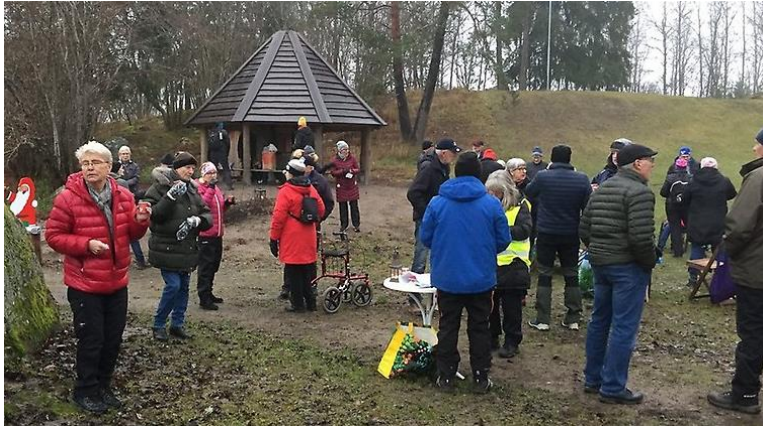
Glöggmingel Kvarnbacken, 13 december