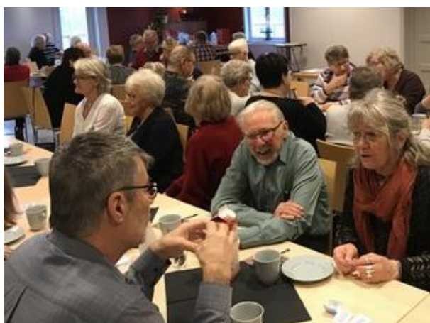
Medlemmar i glatt samspråk