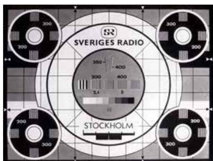
På alla ålderdomshem utom tre i Östergötland fanns TV-apparater 1961 visade en utredning genomförd av PRO.

År 1948 arrangerade distriktet "Folkpensionärernas dag". Programmet innehöll agitation och information om pensionärens situation och därtill storstilade underhållningsprogram. Dessa dagar arrangerades varje år fram till i mitten av 1960-talet. Idag medverkar våra PRO föreningar på "Äldredagar" som arrangeras av många kommuner. Vi medverkar