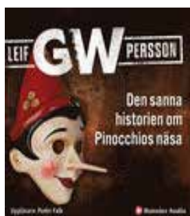
Leif GW Persson Den sanna historien om Pinocchios näsa