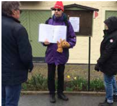
Boule 12 maj