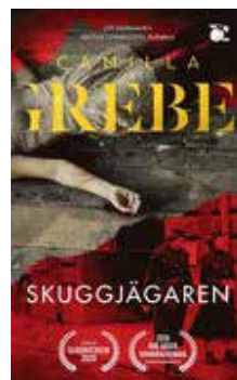
Camilla Grebe Skuggjägaren