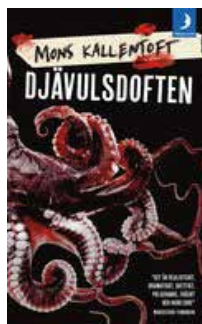
Mons Kallentoft Djävulsdoften