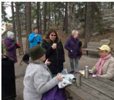
Gökotta 13 maj