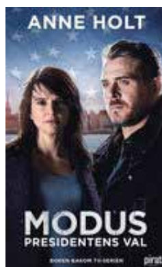
Anne Holt Presidentens val