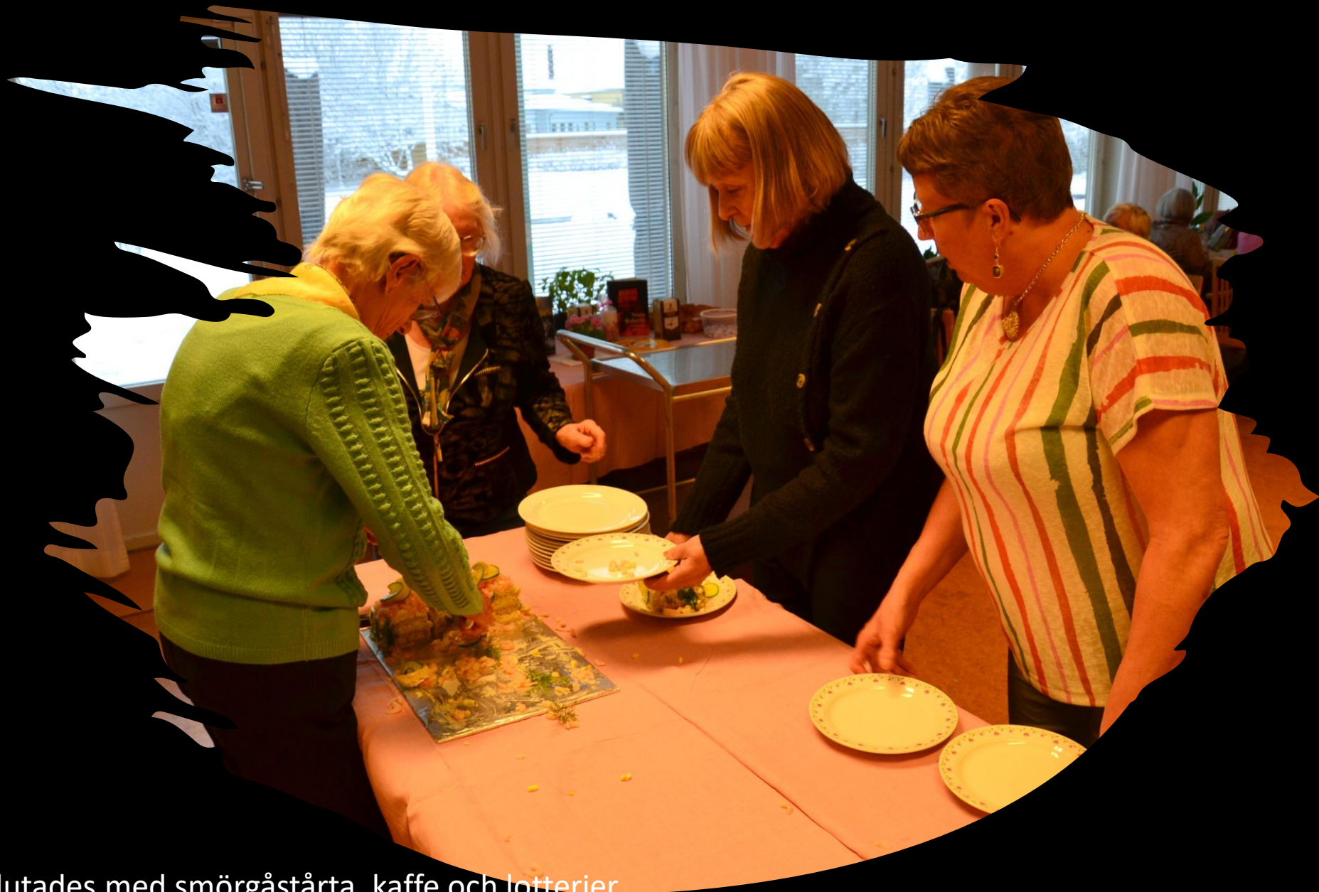
Dagen avslutades med smörgåstårta, kaffe och lotterier