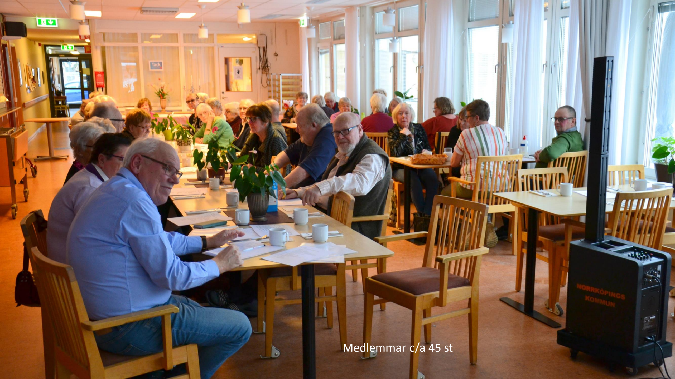
Medlemmar c/a 45 st