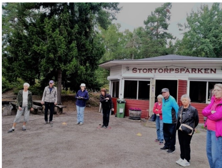
Här tränar och tävlar vi i Stortorpsparken