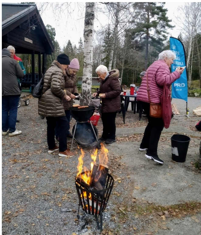
Grillparty i Stortorpsparken