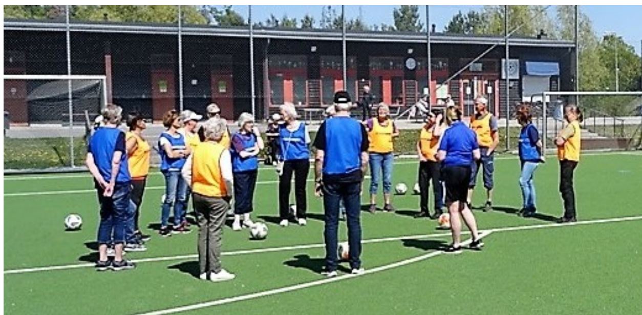
Dags för avspark på Mossen

Aktiviteten bedrivs i samarbete med Skogås Trångsunds FF, som håller med utrustning (mål, bollar, lagvästar m.m.)