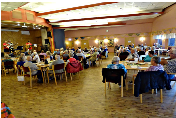
Medlemsträff i september