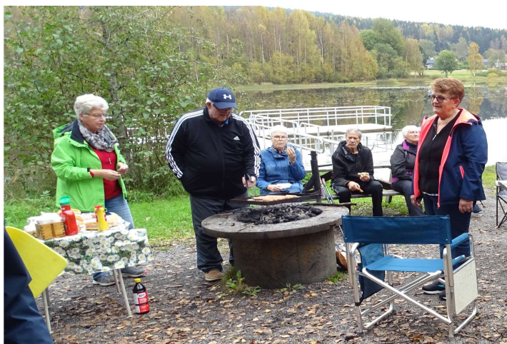
Friluftsdag med tipsrunda och grillning

HLR och krisinformation vid 2 tillfällen ledd av Civilförsvarsförbundet, 10 deltagare per gång.