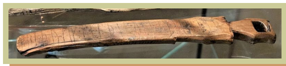
Skälkniv från 1000-talet

Det har gjorts många arkeologiska fynd, cirka 500 000. Ida visade oss också en Skälkniv från 1000-talet som de vävde band med, på kniven var det hållristningar där texten visade sig vara mycket kärleksfull.