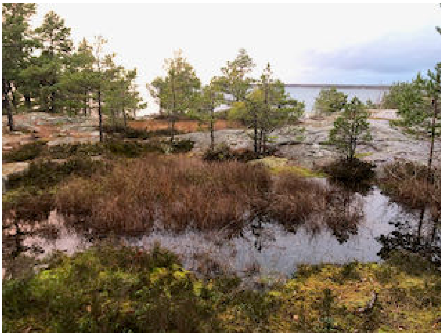
Myrgölen gör sig bäst i november.