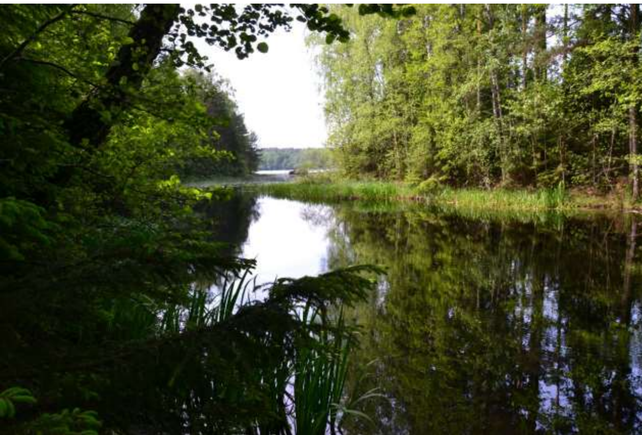
Vy mot Stavsjön