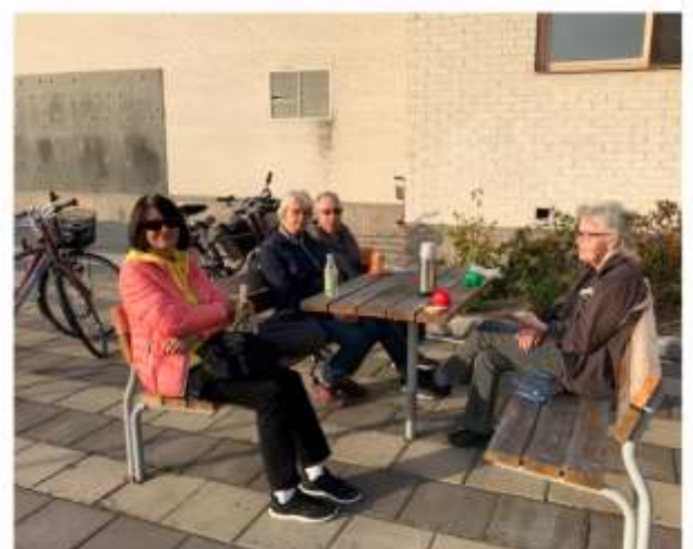
Ett gäng cykelentusiaster tar en paus