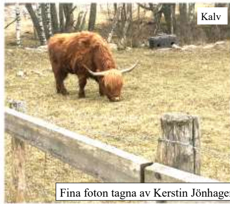
Fina foton från åkturerna på moppen