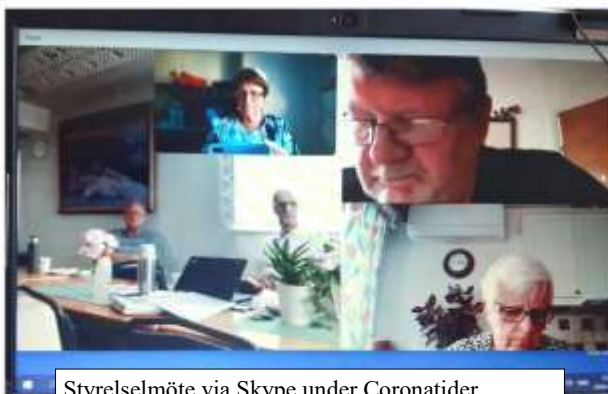
Styrelsemöte via Skype under Coronatider