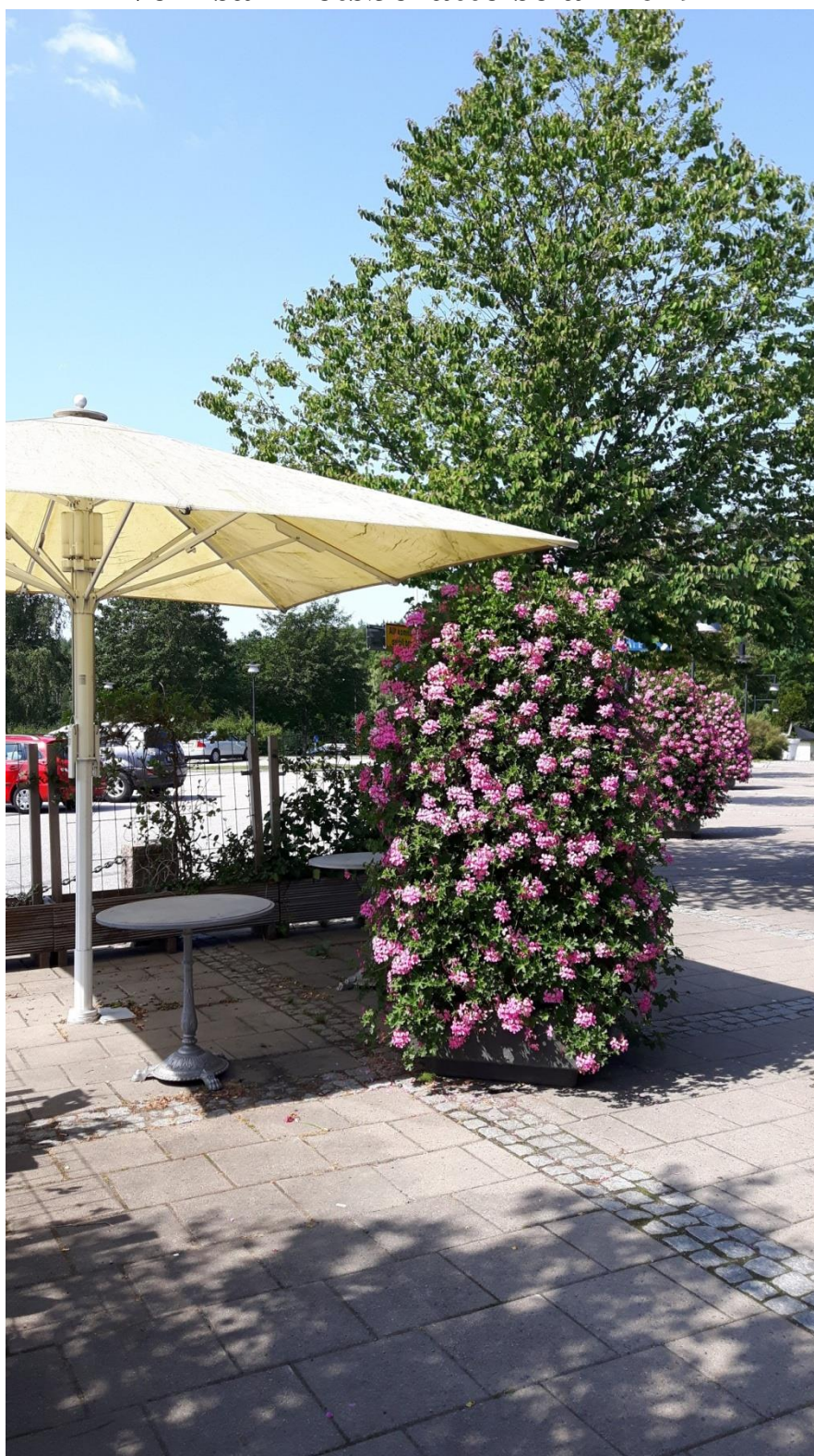
Torget i Viskafors en vacker sommardag 2019