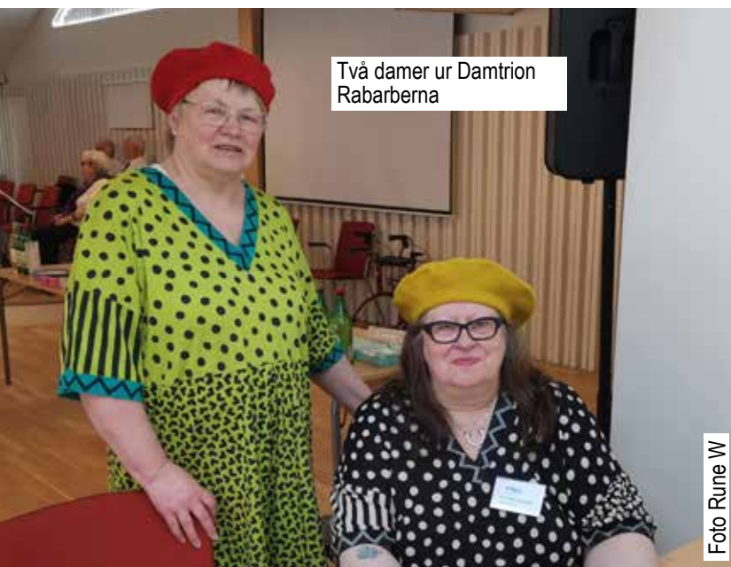
Två damer ur Damtrion Rabarberna