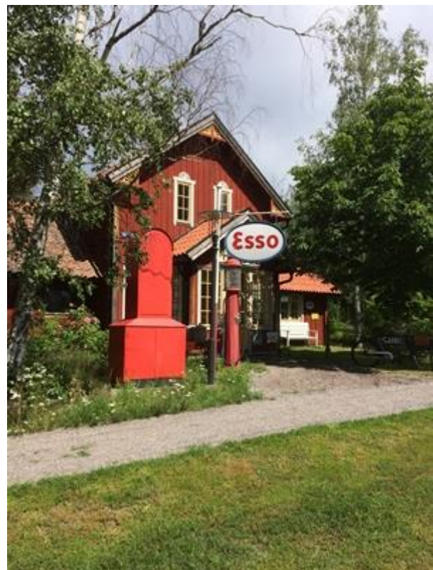
Mack i gammal stil.