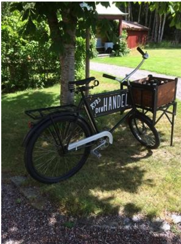
Cykel placerad utanför lanthandeln.