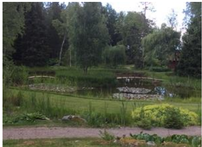
Utsikt från Väsenhuset.