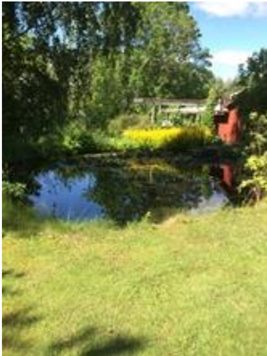
Näckrosdamm invid smedjan.

Vi lät oss väl smaka av den goda maten och därefter guidades vi runt i de olika stugorna av Göte.