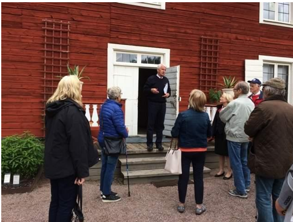
Vår duktiga guide på trappen till Linnés Hammarby.