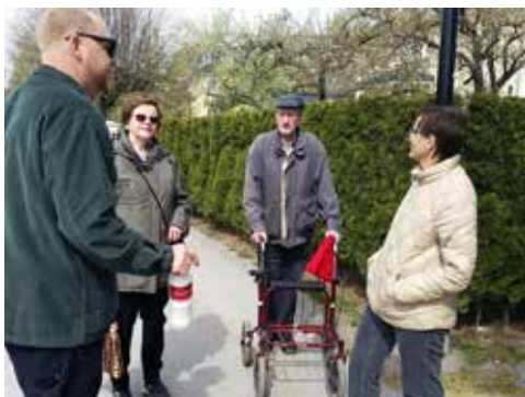
Stadsvandring i Sundbyberg