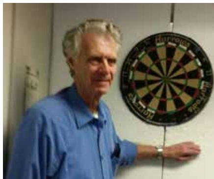
Kvällens vinnare Dart 16 april