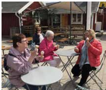
Nynäshamn 15 maj