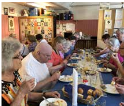
Vårlunch 4 juni