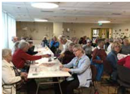
Medlemsmöte 2 maj