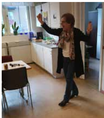
Kvällens vinnare Dart 7 maj