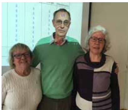
Veteranvetartävling 9 maj