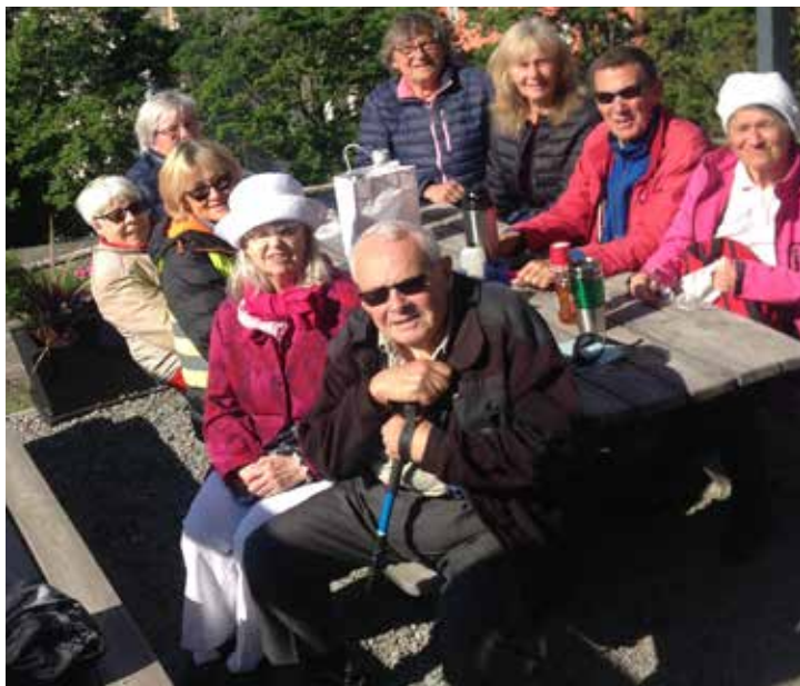
Gökotta 30 maj

Medlemsinformation för PRO Sundbyberg Nr 3/2019