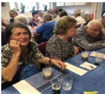
Kräftskiva 22 augusti