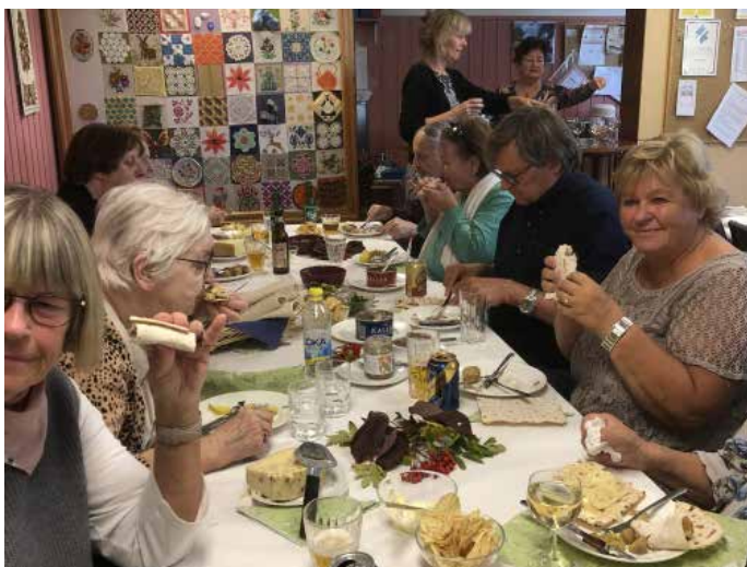
Surströmming 26 september

Medlemsinformation för PRO Sundbyberg Nr 4/2019