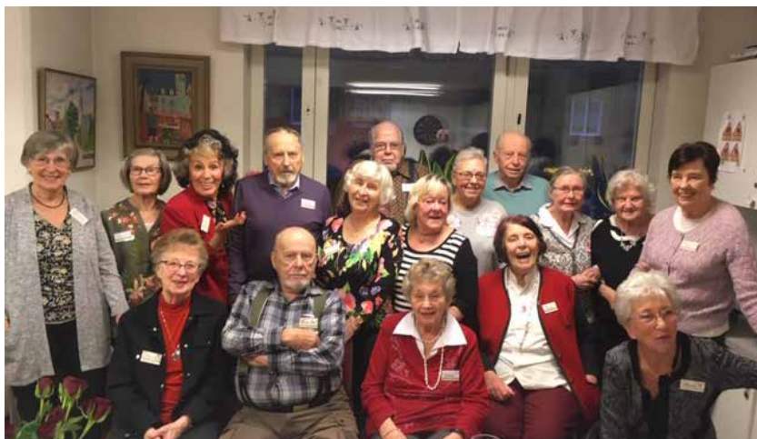
2019 års jubilarer

Medlemsinformation för PRO Sundbyberg Nr 1/2020