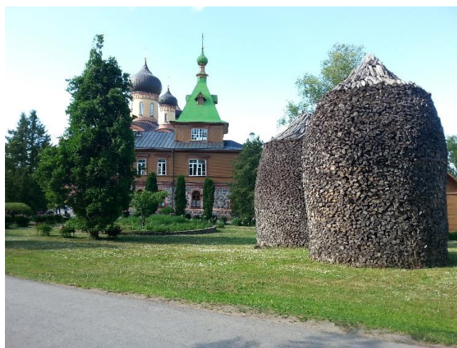
Nunneklostret i Kuremäe med vackert staplad ved. Nedan: besök på bryggeri.