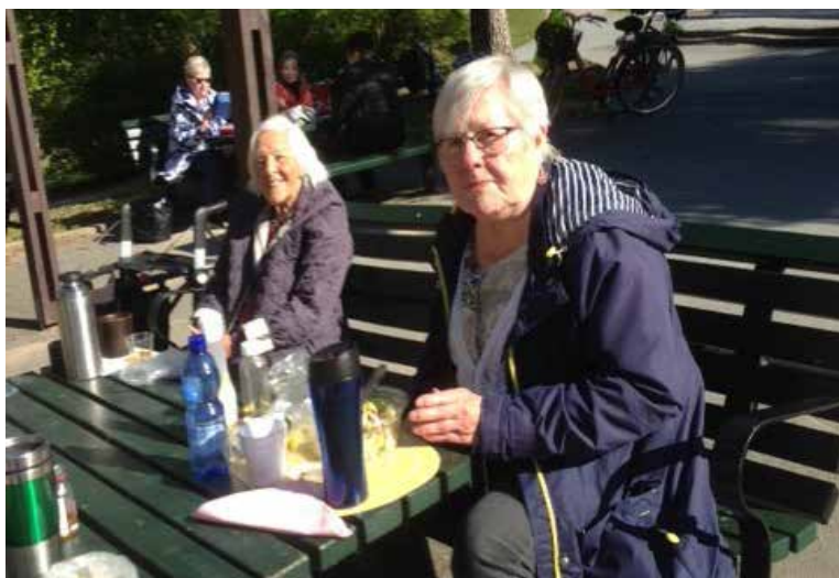
Gökotta 21 maj i Tornparken

Medlemsinformation för PRO Sundbyberg Nr 3/2020