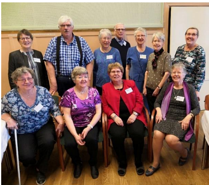
Hela styrelsen samlad.

En jacquardvävstol är enormt stor. Raddan av hålkort till höger i bilden. Väverskan (i bakgrunden) har flera års utbildning för att kunna hantera vävstolen.