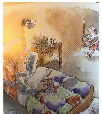
Ingen man har någonsin haft en vanlig förkylning.

Men svårast av allt tycks vara att förändra mig själv.