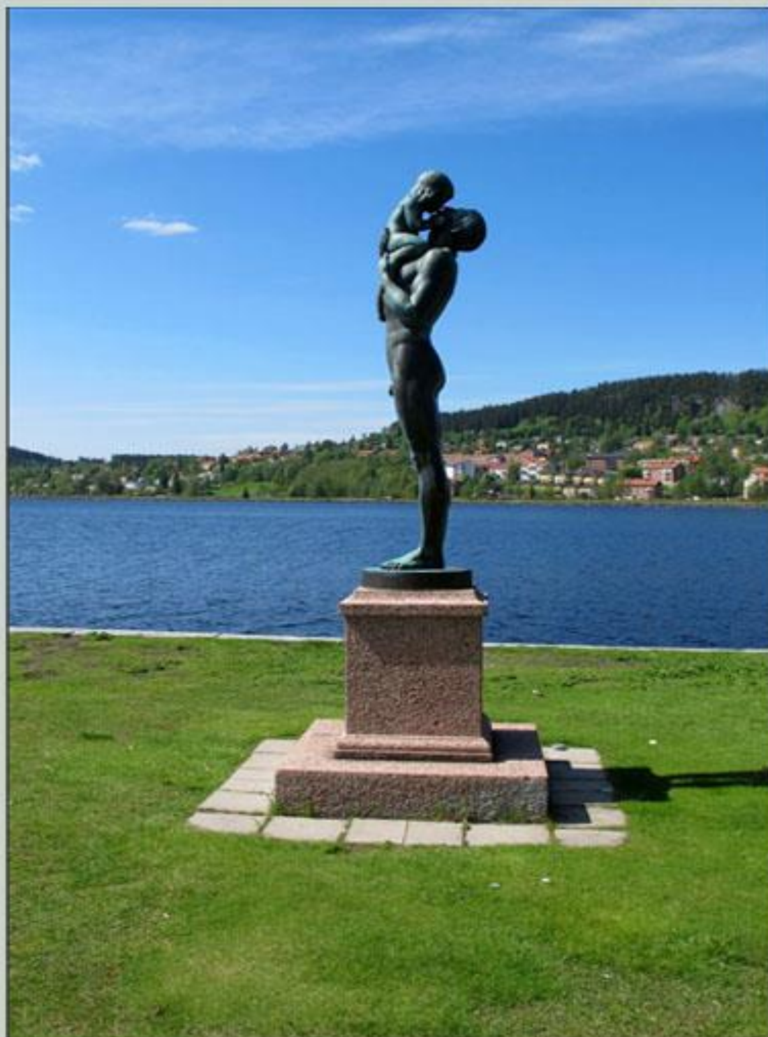
"Far och son" - staty av Olof Ahlberg i Badhusparken