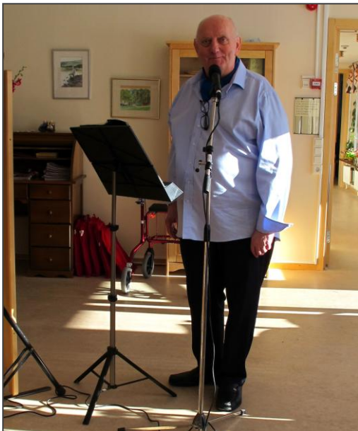
På bilden till vänster en av de musiker som också gärna står för den musikaliska underhållningen för oss i PRO: