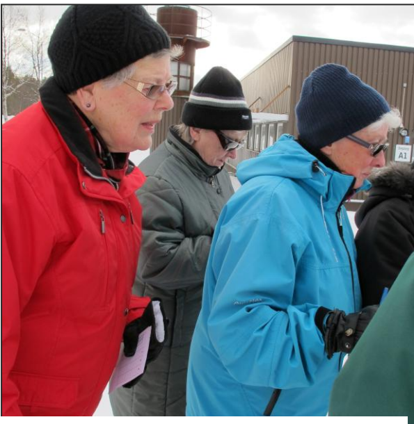
Oj, det där var en svår fråga! verkar dessa damer säga medan.....

Har varit välbesökta. Många har deltagit och även om vädret inte varit särskilt inbjudande har alltid de allra tappreste gått varje söndag. Promenaden startar vid PRO-lokalen i Lövsta. Förutom frisk luft får deltagarna gå en tipsrunda och svara på frågor skrivna av Reidar?. De kan vara riktigt knepiga ibland. Efteråt samlas alla i lokalen för fika och dragning i lotteriet. Tre av deltagarna som svarat flest rätt vinner en lott. Fikat ordnas av två medlemmar i föreningen som anmält sig på en lista som finns i lokalen. Första promenaden meddelas som vanligt i vår annons i LT eller ÖP till hösten.