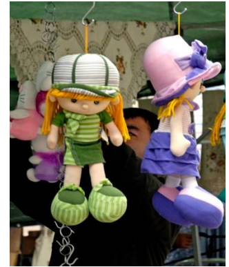
Ett litet exempel på vad som visas på Rättviks marknad

Arrangörerna beräknar minst 100.000 besökare så det blir både folkligt och festligt. Kostnad vid 40 deltagare c:a 1250 kr. Ring Elsy tel 070-5213163 så snart som möjligt om du är intresserad.