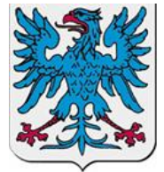
Värmlands landskapsvapen - en blå örn på ett fält av silver

Under temat Res och Lär har i mars startats en studiecirkel om Värmland. Inget specifikt resmål är fastslaget utan det diskuteras fram av medlemmarna i cirkeln. Beräknat resdatum 17-19 juni. Hör av dig till Elsy om du vill delta.