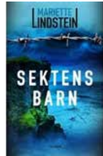
Mariette Lindstein, Sektens barn