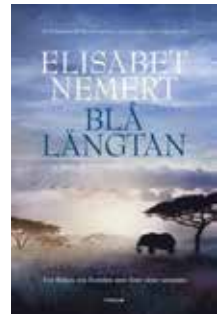
Elisabet Nemert, Blå längtan