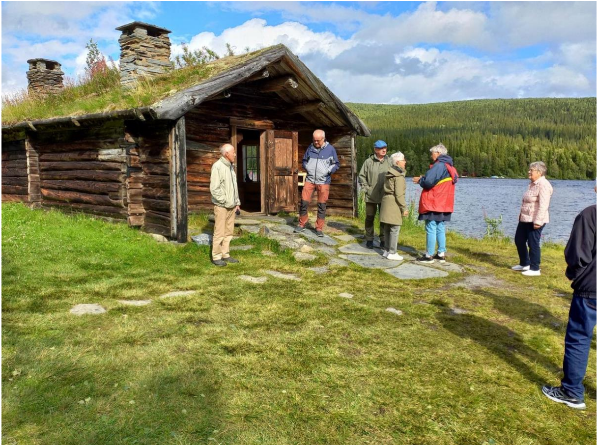
Prästbostad i Fatmomakke.

gammalt ord för bäver. Därav namnet. Bjurälven rinner delvis under jord, genom ett område med kalkberggrund. Därvid bildas ett grottsystem som varje vinter karteras av dykare. För att ta sig in i de vattenfyllda grotorna krävs länsstyrelsens tillstånd. Bjurälvgrottan ligger bara cirka 700 meter från norska gränsen.