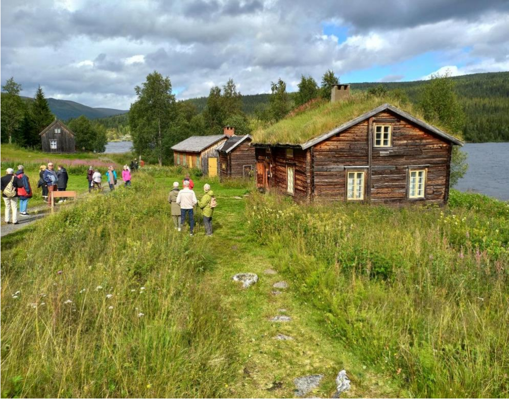
Museibyggnad i Fatmomakke.