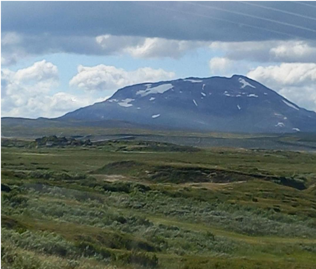
Stekenjokkplatån. Utsikt mot mot norska fjäll delvis med snö.