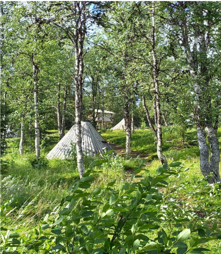
Kåtor i Fatmomakke.