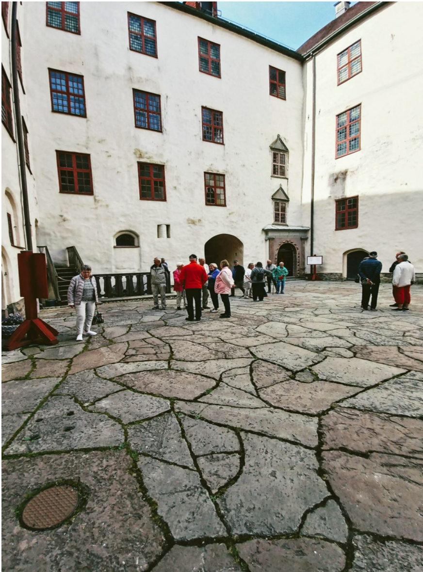
Läckö slott: innergården

En mycket trevlig och väl genomförd resa.