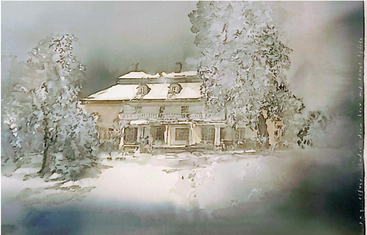
Lars Lerin: Mårbacka i vinterskrud