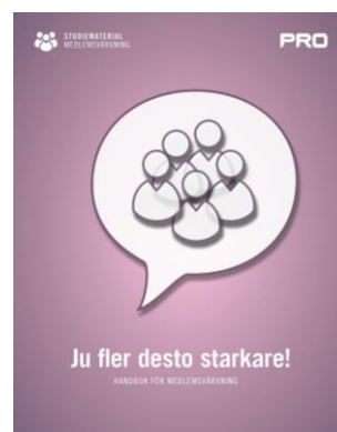
Ju fler desto starkare!