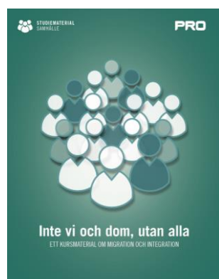
Inte vi och dom, utan alla