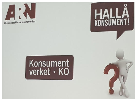
Här klagar man

"Jag bestrider er faktura nr xxxxx (fakturans nr, belopp och datum) på grund av att jag inte har beställt någon vara"