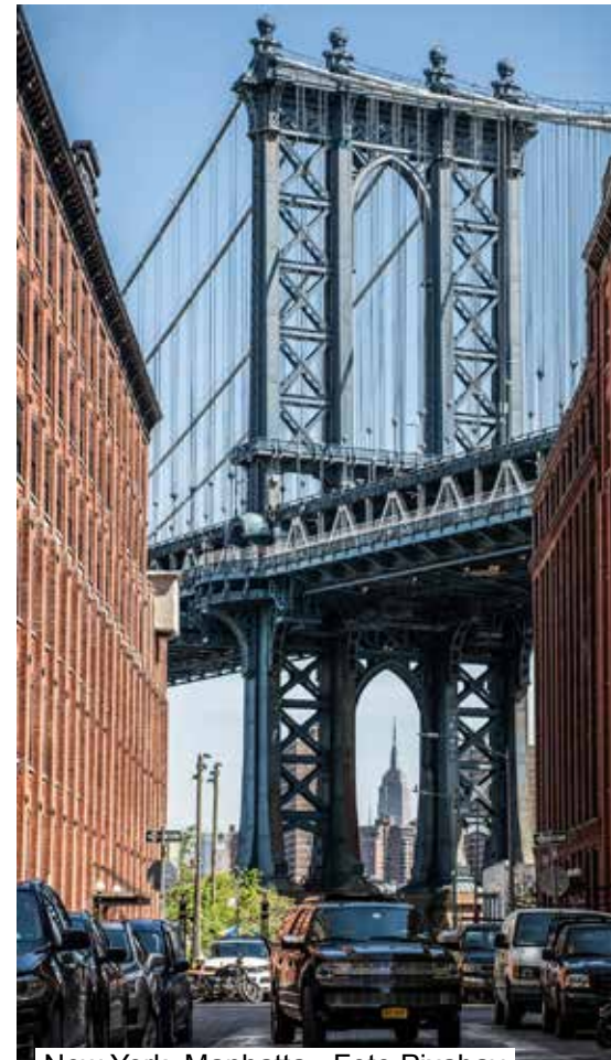
New York, Manhatta