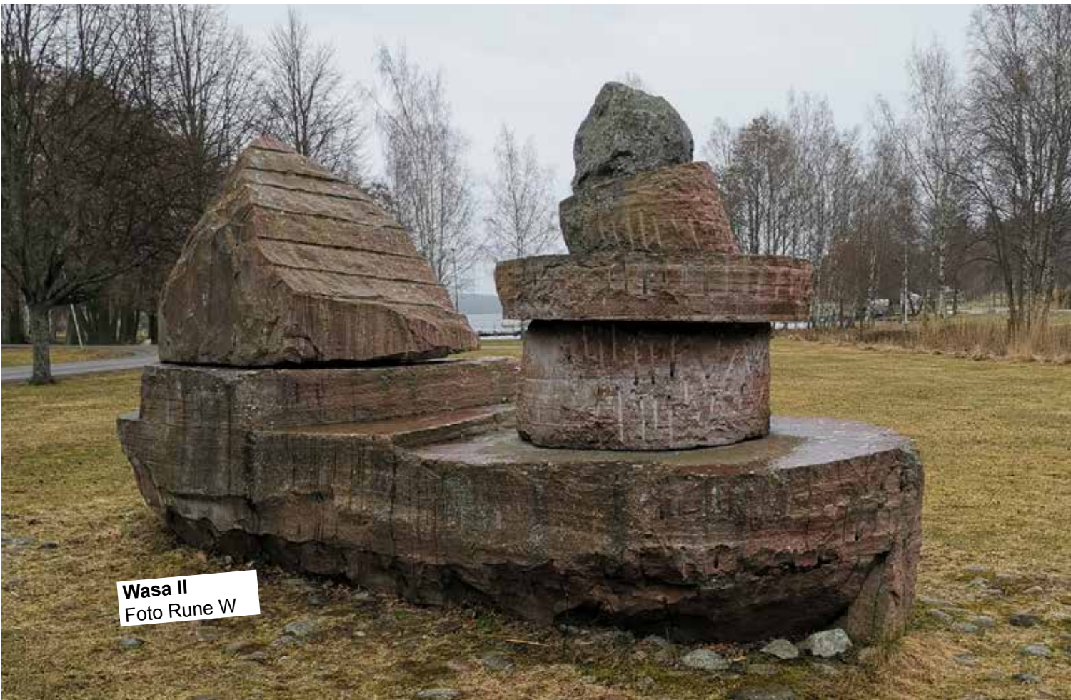
Wasa II

I samma stund kom en äldre dam förbi och undrade om jag kände till något om skulpturen. -Nej, sa jag, fast jag bott i Aronsborg har jag inte sett eller hört något om skulpturen. Damen kände till bakgrunden och sände mig texten till vänster.