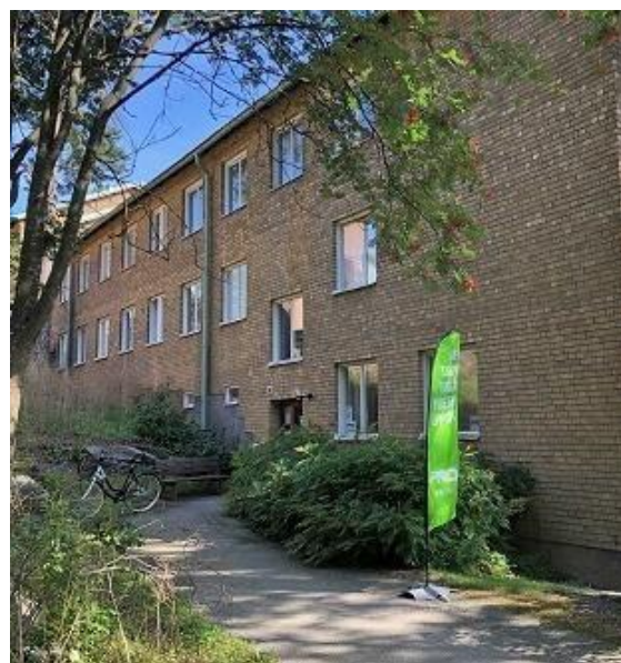
Bilden till höger: Ingång till PRO-lokalen på Furuvägen