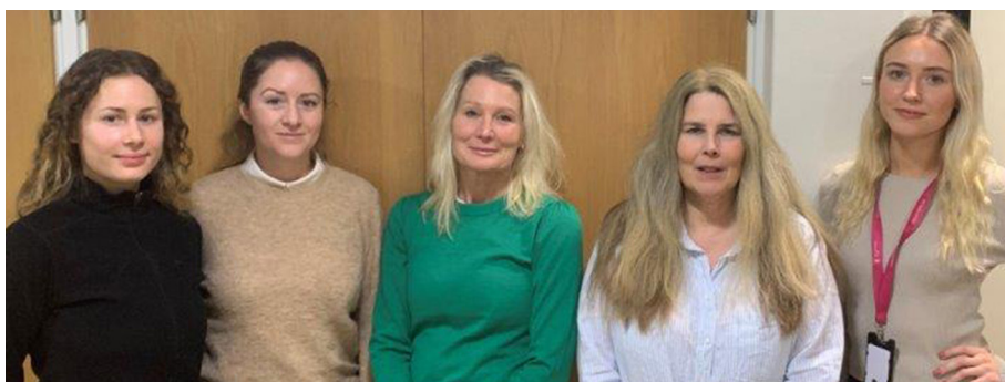
Medarbetare vid beställarenheten, social omsorg vuxen.

Kvitto på att insatser gör skillnad Stadsdelsförvaltningens positiva resultat i brukarundersökningen är högre än stadens resultat.