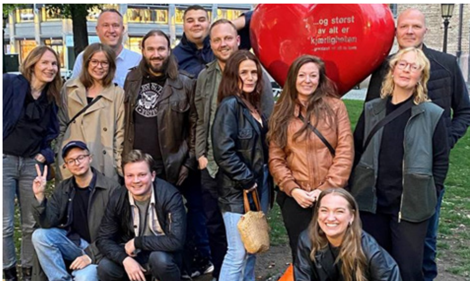
Medarbetare vid missbruksenheten, social omsorg vuxen.