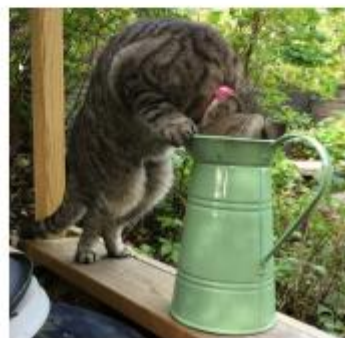
Elsa visar vägen

V i har alla en törst att släcka. PRO Fullersta kan hjälpa dig om det gäller kunskap och upplevelser m.m.