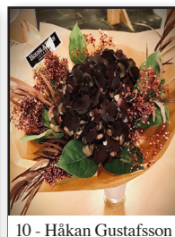
10 - Håkan Gustafsson