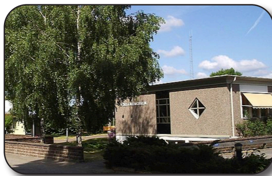
PRO:s möteslokal, Östra Kyrkogatan