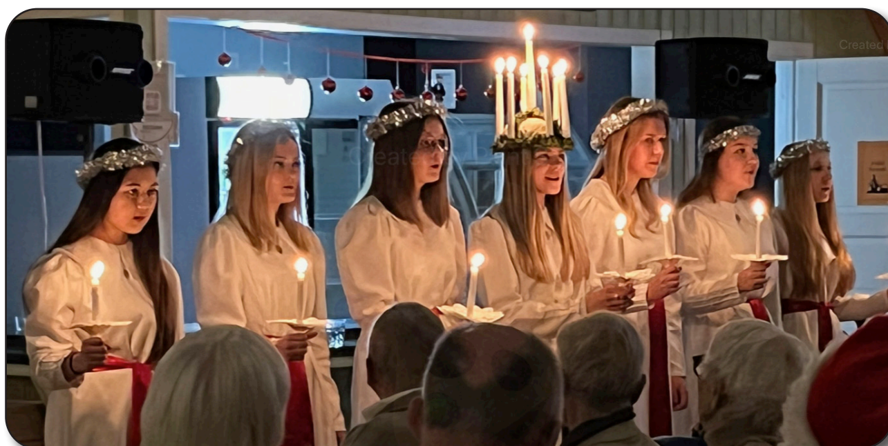
Herrljunga Lucia 2022 på Jubileet i Herrljunga Folkets Park