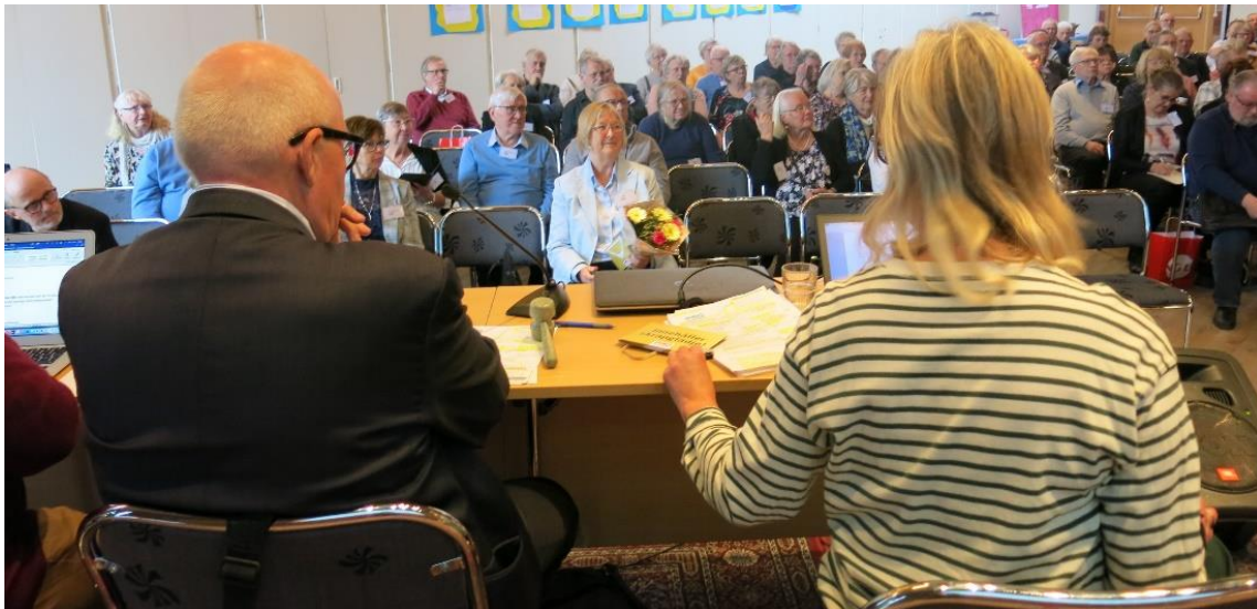
Bild från årsmötet 2022 på Hallunda Folkets hus.

Kallelse till PRO Stockholms län årsmöte den 20 april