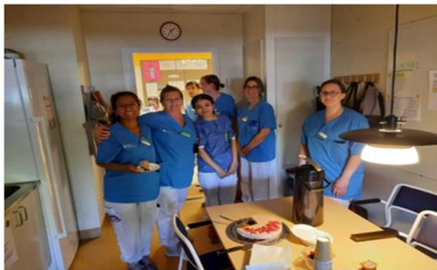
VI ÄR DUKTIGA PÅ ATT ÄTA GOFIKA