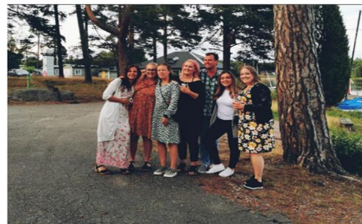
VI ÄR BRA PÅ ATT HA KUL ÄVEN PÅ FRITIDEN