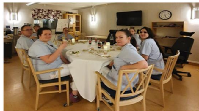
GOTT NYTT ÅR