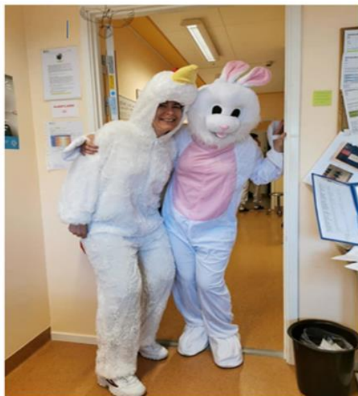
ÄVEN CHEFERNA KAN BJUDA PÅ SIG SJÄLVA