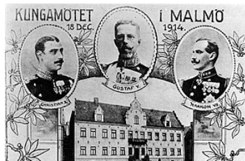
Vykort från Kungamötet