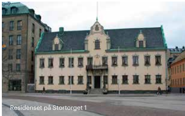
Residenset på Stortorget 1

Vi äldre Malmöbor minns också att på landshövdingens balkong kröntes stadens Lucia. Det var tidningen Arbetet som höll i evenemanget. Tusentals åskådare brukade då samlas för att ta del av traditionen.