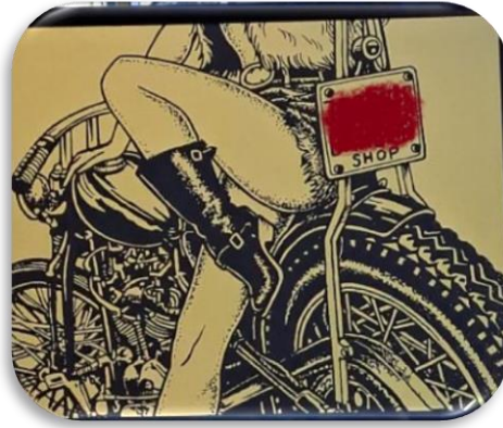
9 Skylt Jessies Barbershop Kungsgatan 23