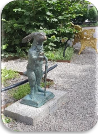
8 Konstverket Underlandet på Köpmangatan vid trappan mot Olof Palmes torg