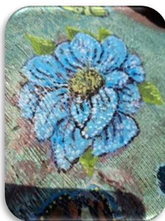
6 Konstverket Rinnande mönster längst ner på Stortorget