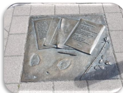
4 Anna Lindhs minnesmärke Våghustorget vid Pumpen