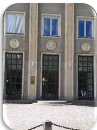
5 Vasastrand 11