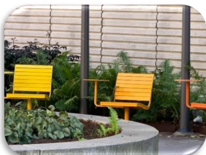
3 Kyrkogatan bakom Nikolai Församlingshem