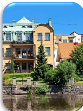
2 Olaigatan från Slottsparken