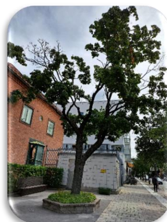
7 Polishuset på Järnvägsgatan kortet taget från Klostergatan