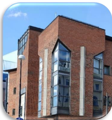
1 Kulturkvarteret, Fabriksgatan