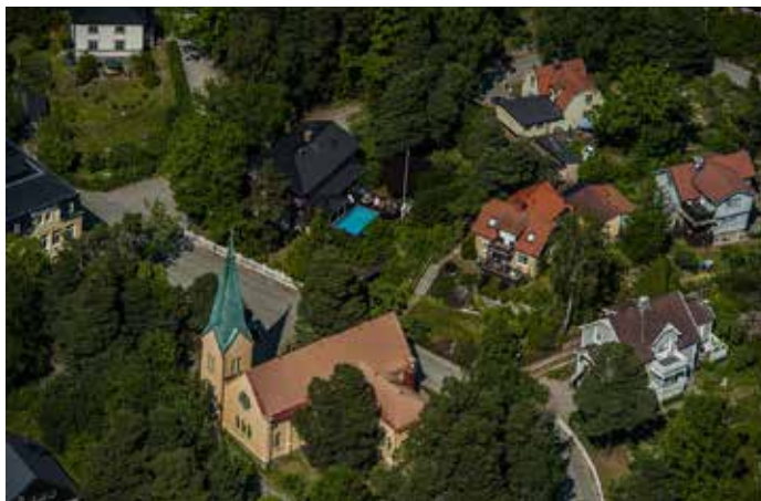
Duvbo från luften