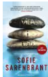
Vila i fred Sofie Sarenbrant