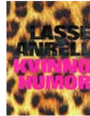
Kvinnohumor Lars Ahnells