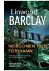
Morgonen hon försvann Linwood Barclay