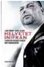
Helvetet inifrån (Femton år i Sveriges största brottsorganisation) Lasse Wierup Daniel Olsson