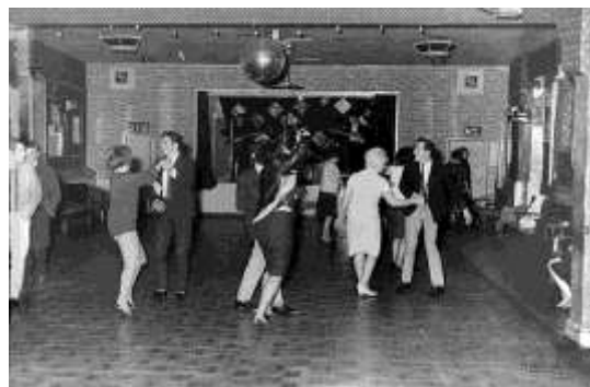
Det okända bandet The Beatles spelar inför 12 personer 1961

Rockmusiken är en viktig musikgenre idag och den står som en symbol för frigörelsen av den yngre generationen. Rockens uppkomst tror man härstammar från början av 1900-talet och det har utvecklats många