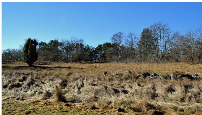
Pysslingebacken från den gamla sjöbotten upp över Litorinavallen där det finns tidiga spår efter människor.

En strandvall, 8 – 9 m ö.h. löper utefter kustlinjen mellan Gisslevik och Kristianopel. Den bildades av Litorinahavet för 7000 år sedan då havsytan var 4 – 7 m över nuvarande nivå, i takt med ett växlande vattenstånd där sand och grus kastades upp av vågorna. Inlandsisen drog sig tillbaka för 12000 år sedan och det skulle dröja ytterligare 4000 år innan spår av människor kan säkras.