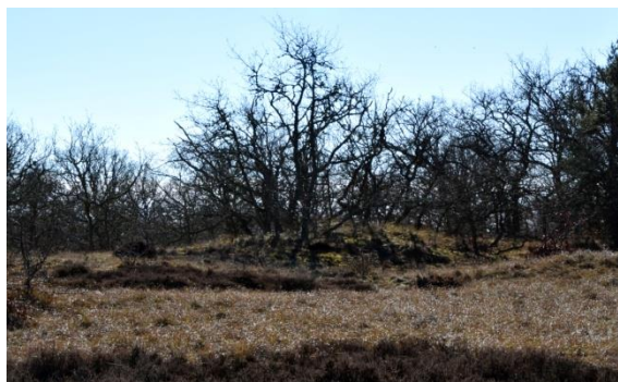
Här har våra tidiga förfäder hållit till.

Redan i en historieberivning från 1793 omnämns Pyslingebacken (stavades då med ett s): ”Nordost från byen är en hög, som kallas pyslingebacken. Här finnes i sanden en mängd lerbitar, som med prickar och linier och allehanda prydnader äro försedda. Desse kallas af allmogen pyslingebröd”. Samme historieskrivare menar att lerbitarna är rester av sönderslagna urnor med brända människoben och att Pysslingebacken var en gravplats eller offerplats. Och så trodde man under större delen av 1800-talet.