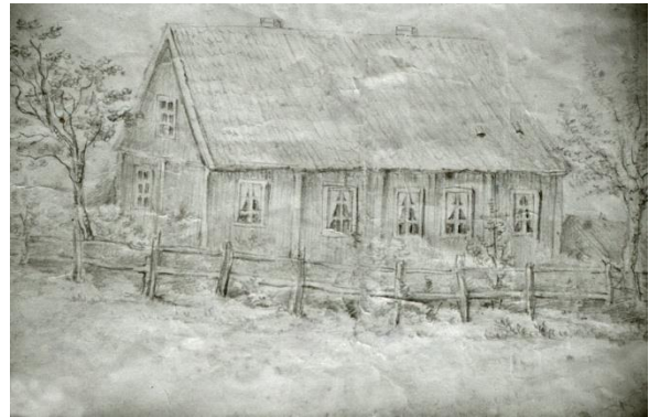
Teckning av den gamla prästgården där församlingshemmet ligger idag.

Torhamnslandets magra, steniga och sandiga jordmån, ständigt utsatt för Östersjöns vindar, var inte särskilt attraktivt bland pastoraten i Lundastiftet. Ty på den tiden fick prästen själva ta ut sin lön i form av hemmansbrukande. Och inte heller var det några större ägor under prästgårdarna, knappt ett halvt hemman. Och två prästgårdar brann ner. Som om det inte vore nog avskräckande så förväntades prästen att ge sig ut på stormiga färder på havet när sockenbud kom från skärgården. Då fanns inga broar till Tjurkö och Sturkö m.fl. öar som ingick i det stora pastoratet. Det blev därför ofta relativt korta ämbetstider och nästan lika ofta slutade ämbetet med döden efter ett relativt kort men slitsamt prästliv.