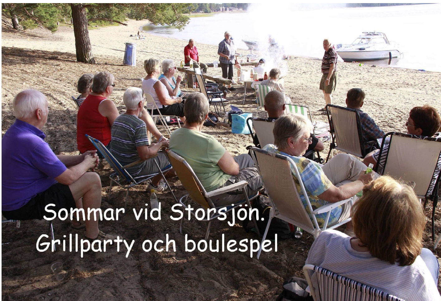
Sommar vid Storsjön. Grillparty och boulespel