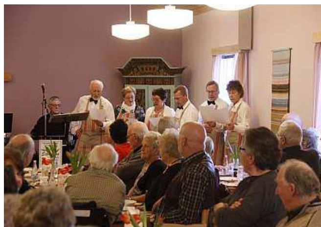
Här är det festkommittén som önskar oss välkomna.