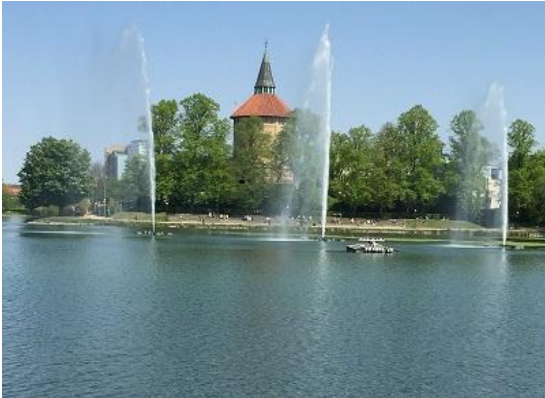
Pildammsparken stora dammen